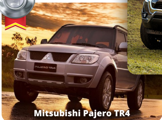
Mitsubishi Pajero TR4